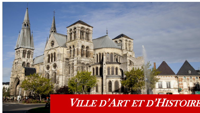
VILLE D'ART ET D'HISTOIRE